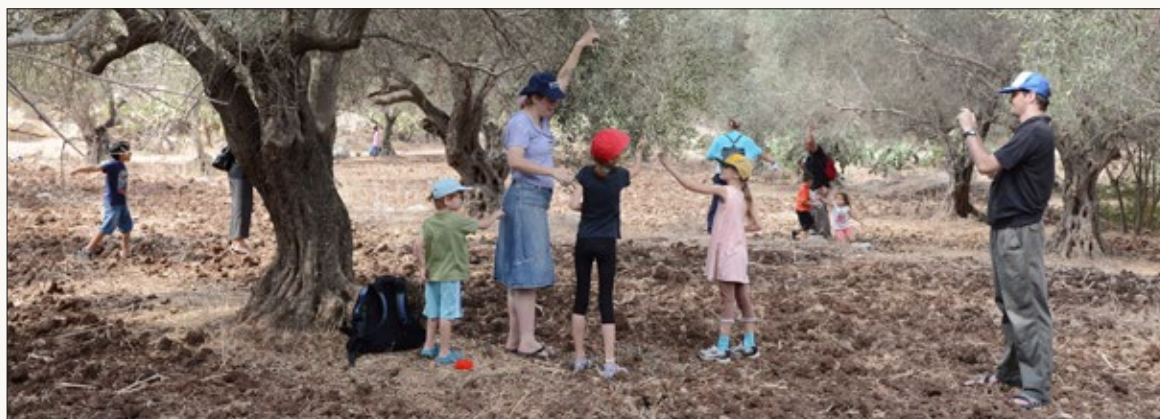
מסיק זיתים בתל חדיד, סוכות, 2013