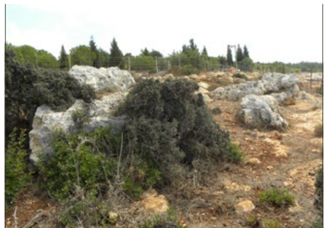
Figure 2 Wild olive trees that preserve their juvenile appearance over time in an area with significant grazing pressure (Adamit Park) תמונה 2 זיתי בר בשטח שיש בו לחץ רעייה משמעותי, השומרים על המופע היובנלי לאורך זמן (פארק אדמית)