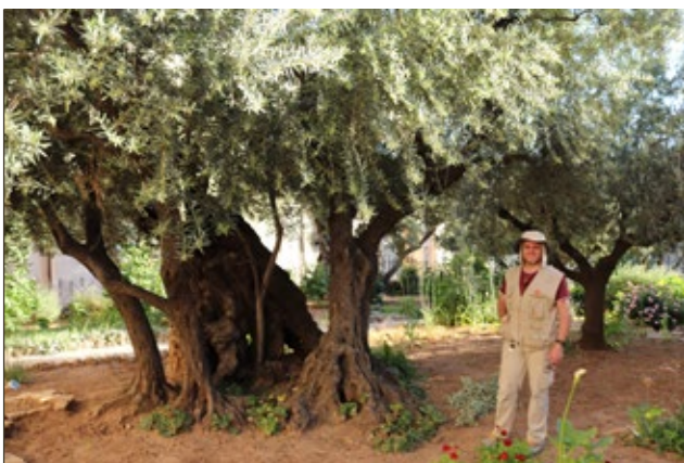
Figure 3 Ancient olive tree in the garden of the Church of Gethsemane תמונה 3 אחד הזיתים העתיקים בחצר כנסיית גת שמנים

תארוך זיתים עתיקים: אחת השאלות שנשאלות לעיתים קרובות היא מה גילם של הזיתים העתיקים? ליבת הגזע של עצי זית הולכת ונרקבת עם השנים, כך שהגזע העתיק חסר ואינו מאפשר בדיקה, לא באמצעות ספירה של טבעות שנתיים (דנדרוכרונולוגיה) ולא באמצעות פחמן 14 (בדיקה המבוצעת בדרך כלל על העצה העתיקה בעץ, הנמצאת בליבת הגזע). אי לכך, מעטים המקרים שהצליחו לתארך בהם זיתים עתיקים חיים בעזרת פחמן 14 לגיל העולה על 300 שנה (Ehrlich et al., 2017). נוסף על כך, קביעה דנדרוכרונולוגית בזית אינה אפשרית מכיוון שהטבעות אינן נוצרות בכל שנה, ולעיתים אזורים מסוימים בהיקף הגזע גדלים בעוד אחרים מפסיקים לגדול (ארליך, 2020). כדוגמה חריגה לכלל זה נציין את עצי הזית העתיקים בחצר כנסיית גת שמנים (תמונה 3), שעל פי המסורת מיוחסים לזמנו של ישו, לפני כאלפיים שנה, אך בתארוך בעזרת פחמן 14 ובשיטות דנדרוכרונולוגיות נמצא כי הם בני כ-800 שנים, כלומר מהמאה ה-12 לספירה (Bernabei, 2015).