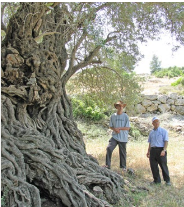
Figure 11 Head of the Beit Jimal Monastery at the side of an ancient olive tree trunk תמונה 11 גזעו של עץ הזית העתיק ולידו אב המנזר של בית ג'ימאל

מאמר זה הציג את החשיבות הרבה של ישראל כאזור שביות הזית החל בו, ואת משמעותו התרבותית וההיסטורית של הזית למדינה. אין