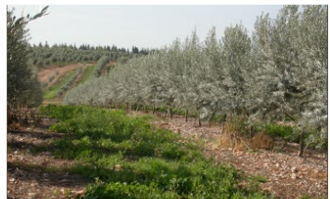
Figure 8 Modern intensively cultivated olive orchard in the Judean Lowlands Encouraging wild cover plants between the rows significantly reduces soil erosion and improves soil fertility. תמונה 8 מטע זיתים אינטנסיבי מודרני בשפלה עידוד צמחיית הבר בין השורות חשוב להקטנת סחיפת הקרקע ולישיפור פוריותה.

זיתים גדלו בחקלאות בעל בארץ בעיקר באזורי הגבעות וההרים הנמוכים באזורי הגליל, השומרון, והרי ושפלת יהודה. בדרומה של הארץ, באזורים של ממוצע גשמים שנתי של מתחת ל-300 מ"מ, לא נמצאו כמעט זיתים (תמונה 9). יוצאים מהכלל היו עצי זית שגודלו בנגב